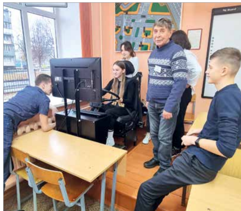
Управление грузовым автомобилем на автотренажёре