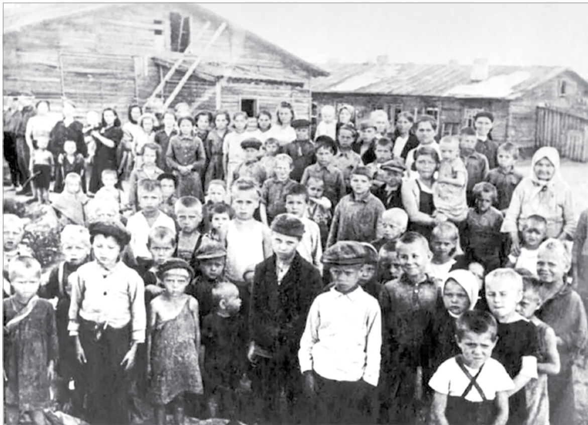
Войною искалеченное детство. Советские дети – узники финского концлагеря

шения лагерного режима, упущения в работе нарушителей ожидали жестокие наказания: “избиения их резиновой плеткой с металлическим наконечником, трубкой от противогаса, начиненной песком, палками, прикладами и др.”. А еще применялось содержание в будке, в Пряженской тюрьме, лишение пайка на 5 суток, дополнительный тяжелый труд.